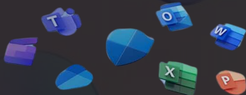
Microsoft 365 Apps