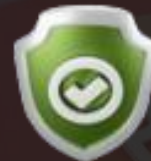
Ai Safety Mechanisms